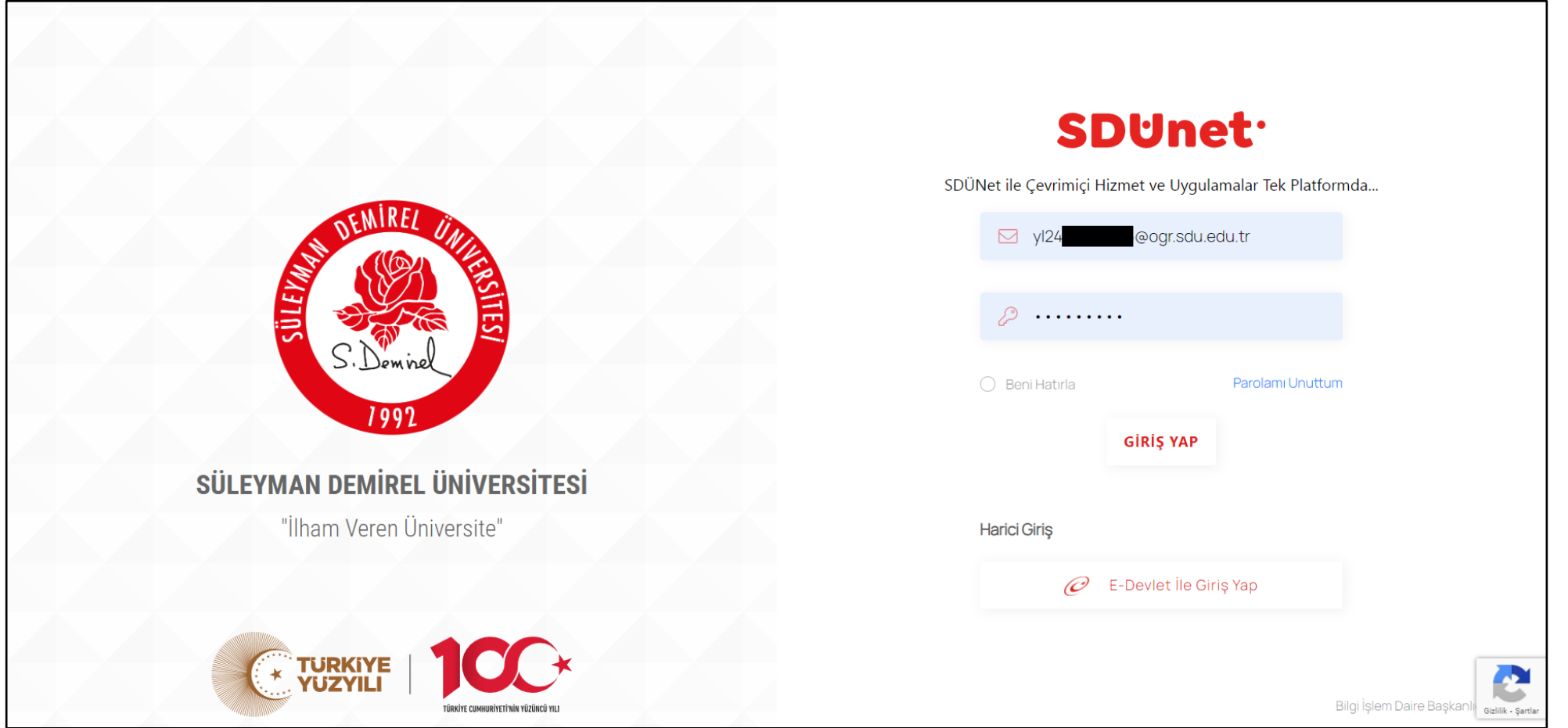
Görsel 1. SDUnet'e giriş ekranı

https://sdunet.sdu.edu.tr/ adresinden SDUnet'e erişilerek giriş yapılır. Yüksek lisans öğrencileri "yl", sanatta yeterlik öğrencileri ise "d" kodundan sonra öğrenci numaralarını ekleyerek atanan e-posta adreslerini kullanabilirler. Parolanız; ilk oturum açma esnasında TC kimlik numarasının son sekiz hanesidir. Kullanıcılar E-Devlet ile de sisteme giriş yapma imkânına da sahiptirler.