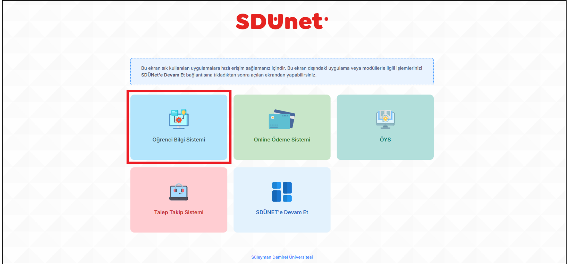
Görsel 2. Öğrenci Bilgi Sistemi'ne giriş ekranı

SDUnet'e erişildikten sonra Görsel 2'de işaretlenmiş alanda gösterilen seçenek olan "Öğrenci Bilgi Sistemi" butonu ile öğrenci bilgi sistemine giriş yapılır.